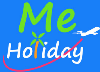
ส่งเกตุป้ายต้อนรับ ที่จุดนัดพบ