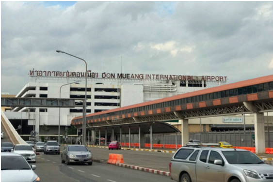
พบกันที่ สนามบินดอนเมือง