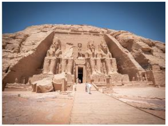
สมควรแก่เวลานำท่านเดินทางกลับเมืองอัสวาน