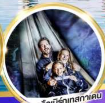
เหมืองเกลือบิรท์เทสกาเดิน