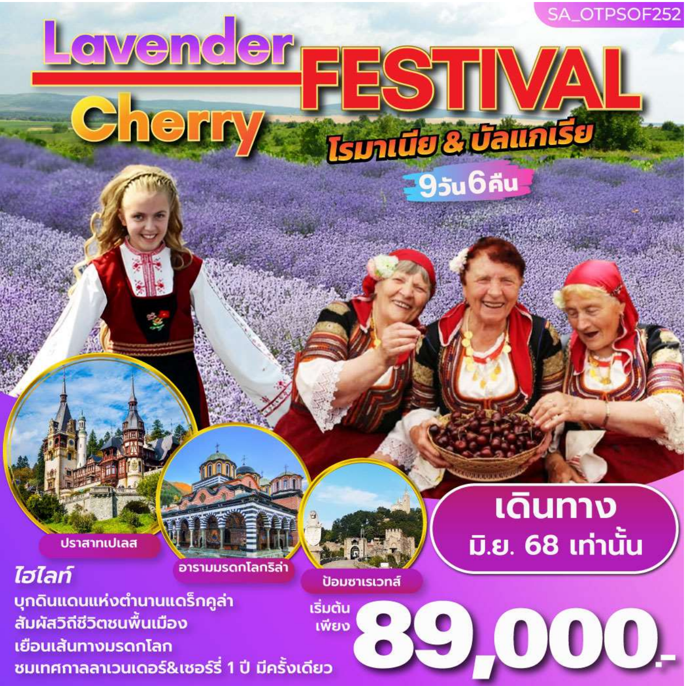
ปราสาทเปเลส