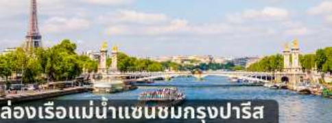
ล่องเรือแม่น้ำแซนชมกรุงปารีส