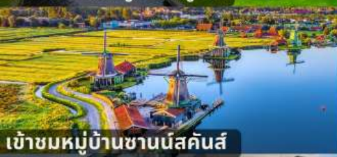
เข้าชมหมู่บ้านชานนิสคันส์