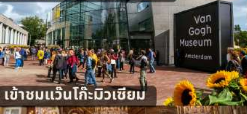
เข้าชมแวนโก๊ะมิวเซียม