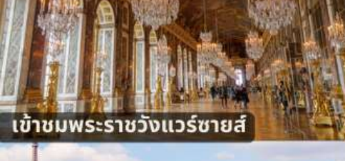
เข้าชมพระราชวังแวร์ซายส์