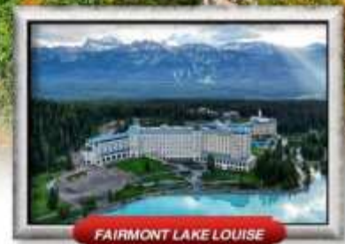
FAIRMONT LAKE LOUISE

บินทรู สายการบิน Full Service | เมนูพิเศษ! แคนาดาเคียนลิออนสแควร์