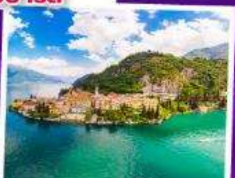
ทะเลสาบโคโม

เดินทาง 31 พ.ค. - 07 มิ.ย. 68 08-15 ส.ค. 68