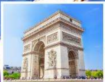
ประตูลีปารีส