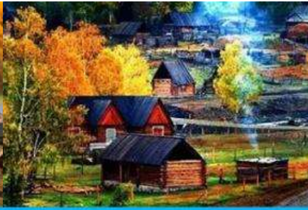
บ้านชนเผ่าถูหว่า