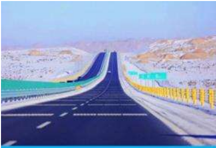
S21 DESERT HIGHWAY