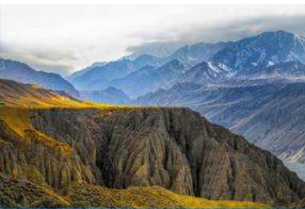
เมืองเคอลาหม่า

พักที่ SUTONG HOLIDAY HOTEL โรงแรมระดับ 4 ดาวหรือเทียบเท่าในเมืองปูเอ่อจิน