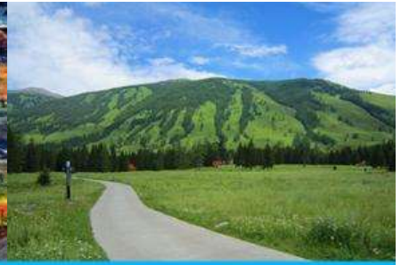
อุทยานคาบาสือ