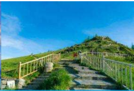
จุดชมวิวกานาสี้อ