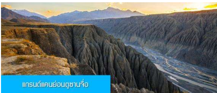
แกรนด์แคนยอนตูซันจื่อ

พักที่ RUI JING HOTEL โรงแรมระดับ 4 ดาวท้องถิ่นหรือเทียบเท่าในเมืองชุยจุน