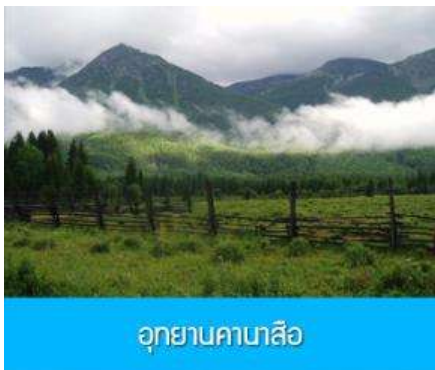
อุทยานคาบาสือ