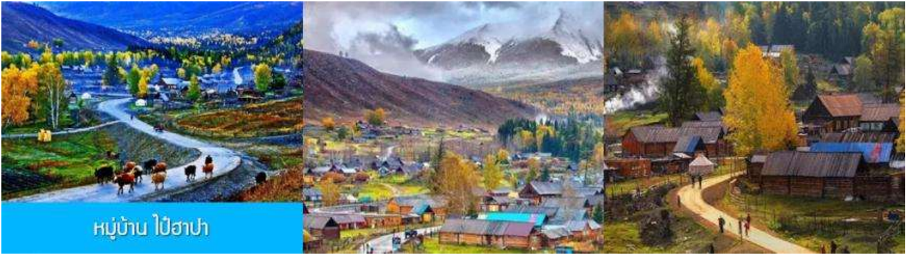
หมู่บ้าน ไปฮาปา

วันที่ห้า อุทยานคานาสีรอบที่สอง – หมู่บ้านไปฮาปา(หมู่บ้านสวยสุดในใต้หิ่ล่า) – เมืองปูเอ่อจิน