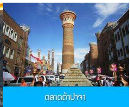
ตลาดต้าปาจา