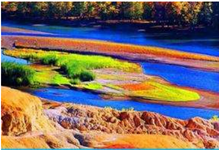
หาดธารน้ำห่าลี