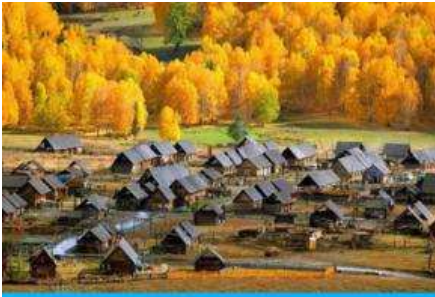
หมู่บ้านเหม่จูซุน