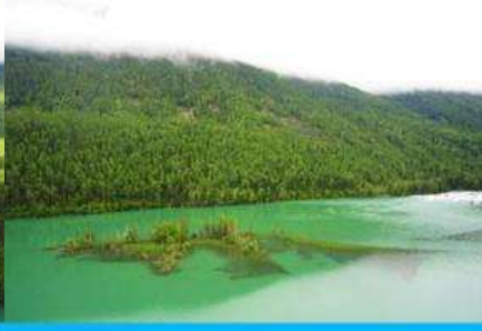
ทะเลสาบบึงกรหลับ