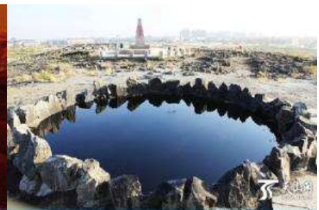
บ่อน้ำมันสิต้า

วันที่หก เมืองปูเอ่อจิน – เมืองเคอลาหม่าอิ- เมืองฝือเอ่อเหอ-บ่อน้ำมันดิบสิต้า-เมืองชุยถุน