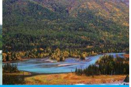
ทะเลสาบเทวดา