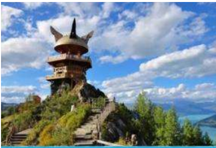
ศาลาชมปลา

รับประทานอาหารกลางวัน ณ ร้านอาหารในเขตอุทยานฯ (เมนูอาหารอัฟเกรด 80 หยวน/หัว)