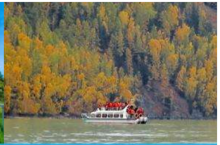
ล่องเรือชมทะเลสาบคานาสี้อ

หลังอาหารเช้าท่านสู่ จุดชมวิวคานาสี้อ 喀纳斯观景台 จุดชมวิวนั้นสูงที่สามารถมองเห็นทัศนียภาพของอุทยานจากมุมสูง....ชม ศาลาชมปลา 观鱼亭 หอชมวิวนยอดเขาอยู่ทางด้านทิศตะวันตกของอุทยานฯ อยู่สูงเหนือระดับน้ำในทะเลสาบ 600 เมตร (เหนือระดับน้ำทะเล 2030 เมตร) ณ จุดนี้ท่านสามารถมองเห็นทัศนียภาพโดยรอบที่ประกอบด้วยทุ่งหญ้า ป่าไม้ ภูเขาหิมะที่ห่างไกลภายในอุทยานคานาสี้อ (การขึ้นหอชมปลาต้องปีนบันไดหลายร้อยขั้น ท่านที่ไม่สะดวกที่จะปีนบันไดสามารถชมวิวยู่ด้านล่าง)