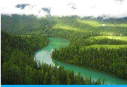
ทะเลสาบเลี้ยวพระจันทร์