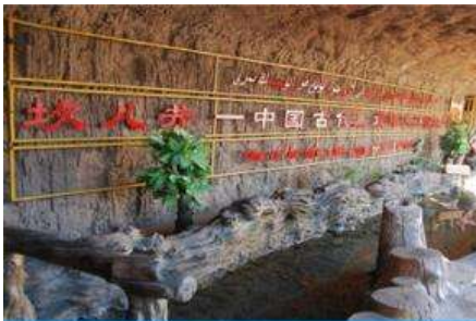
ระบบชลประทานกู๋หลู่ฟาน

พักที่ HAMPTON BY HILTON HOTEL โรงแรมระดับ 4 ดาวหรือเทียบเท่าในเมืองกู๋หลู่ฟาน