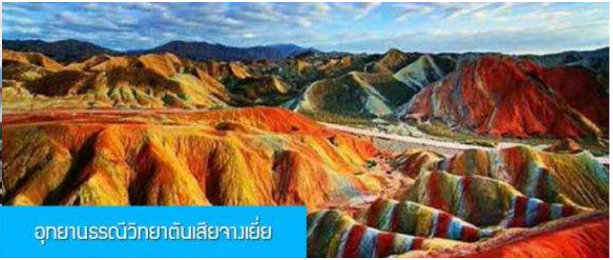
อุทยานธรณีวิทยาต้นเสี้ยวเจีย

วันที่สอง เมืองหลันโจว – นั่งรถไฟความเร็วสูงสู่เมืองจางเยี่ย – เที่ยวชมอุทยานธรณีวิทยาต้นเสี้ยว(ภูเขาสายรุ้ง)