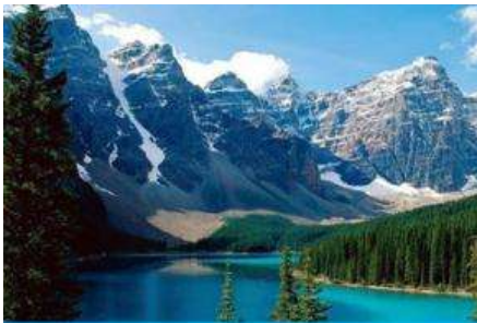
ภูเขาเทียนชาน

พักที่ MERCURE HOTEL โรงแรมระดับ 4 ดาวท้องถิ่นหรือเทียบเท่าในเมืองอูรูมูฉี