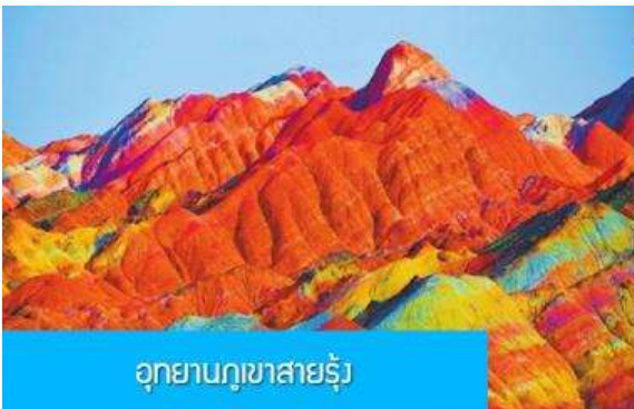
อุทยานภูเขาสายรุ้ง