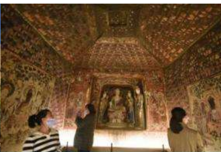
ชมภาพยนตร์ 3 มิติ