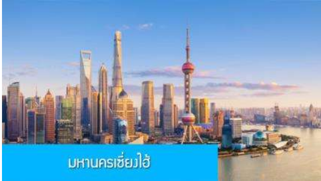
มหานครเซี่ยงไฮ้