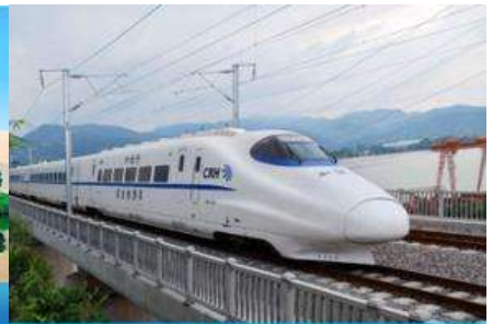
บั้งรถไฟความเร็วสูง