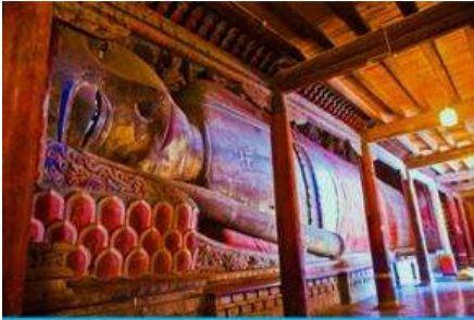
วัดพระใหญ่

พักที่ SILU QIAN XI HOTEL โรงแรมระดับ 4 ดาวท้องถิ่น หรือเทียบเท่าในเมืองจางเยี่ย