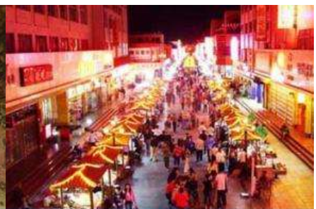
ตลาดกลางคืน ซาโจว