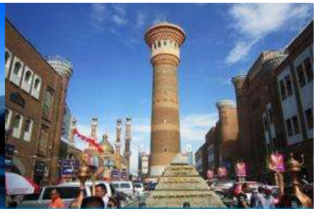
ตลาดต้าปาจา