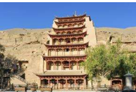
ถ้าซินมั่วกาอู

พักที่ REZEN HOTEL ระดับ 4 ดาวท้องถิ่นหรือเทียบเท่าในเมือง เจียยวี่กวน