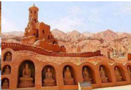
ถ้ำพระพันองค์