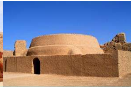
เมืองโบราณเกาซางกู่เจิง