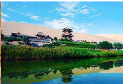
สระบัววังพระจันทร์