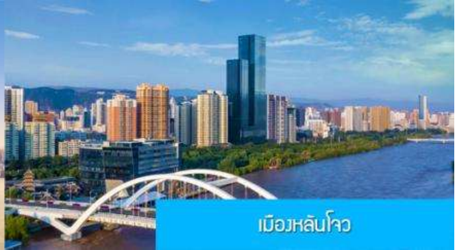
เมืองหลันโจว