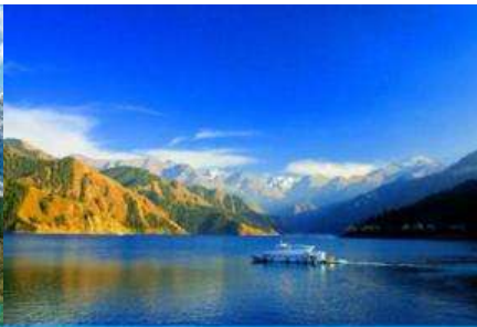
ล่องเรือทะเลสาบเทียนฉือ