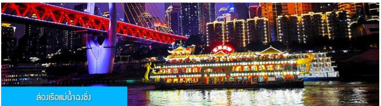
ล่องเรือแม่น้ำฉางชิ่ง