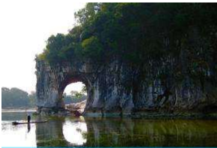
เขาวงช้าง

พักที่ GUILIN VIENNA HOTEL โรงแรมระดับ 4 ดาวท้องถิ่น หรือเทียบเท่าในเมืองกุ้ยหลิน