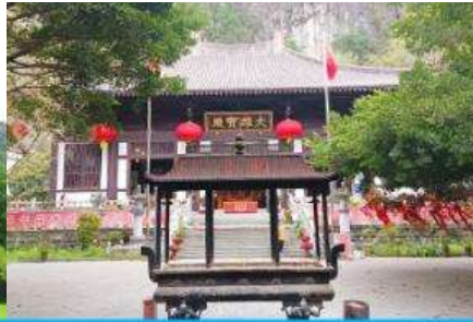
วัดซีเสี่ย