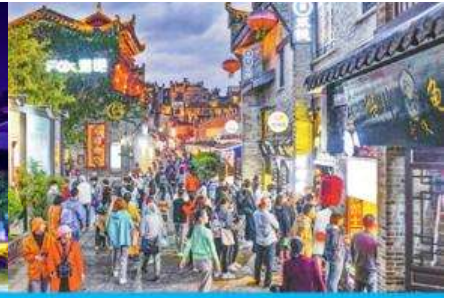
ย่าน ตงซีเซียง