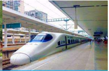
นั่งรถไฟความเร็วสูง