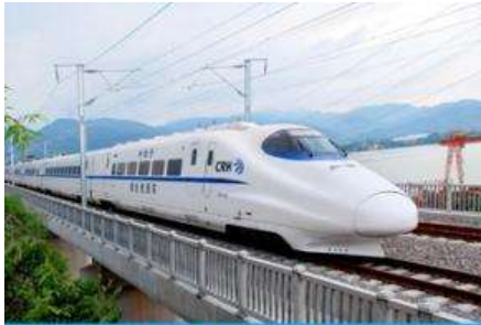
บั้งรถไฟความเร็วสูง

ขบวนรถไฟเดินทางถึงสถานีรถไฟเมืองกุ้ยหลิน นำท่านเดินทางสู่เมืองกุ้ยหลิน