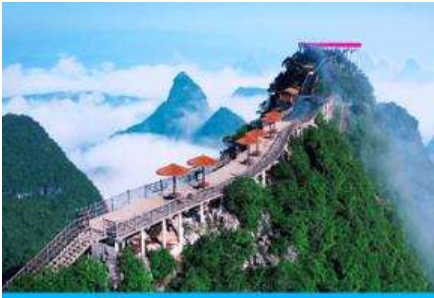
นั่งกระเช้าขึ้นเขาหุ้ยฝิง