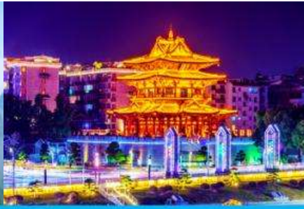
หอชิวเหยาโหลว