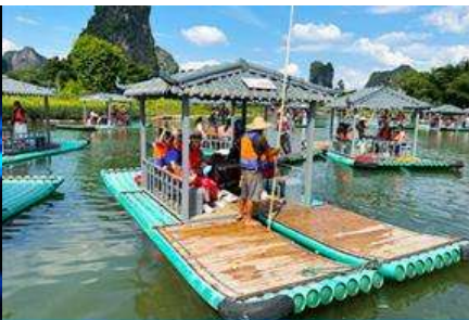
ขั้วเรือแพชมแม่น้ำหลีเจียง