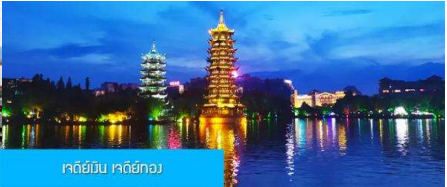
เจดีย์เงิน เจดีย์ทอง