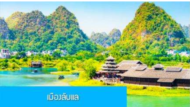
เมืองลิบแล