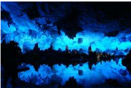
ถ้ำขลุ่ยอ้อ

พักที่ GUILIN VIENNA HOTEL โรงแรมระดับ 4 ดาวท้องถิ่น หรือเทียบเท่าในเมืองกุ้ยหลิน