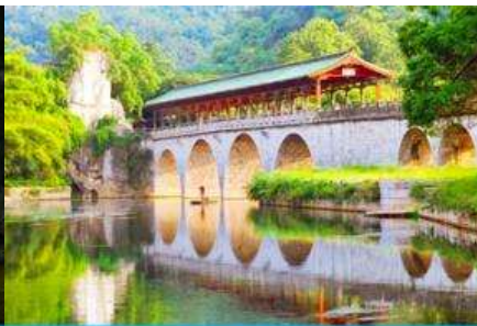
สวนเจ็ดดาว