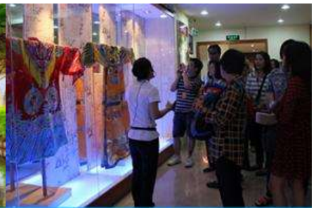
ร้านผ้าไหม

16/4 เมืองกุ้ยหลิน –เขาวงช้าง-ศูนย์จำหน่ายผ้าไหม-สวนเจ็ดดาว-เขาลูจู้-วัดซีเสี่ย-ศูนย์จำหน่ายหยก-ชั้นรถไฟความเร็วสูงสู่เมืองหนานหนิง