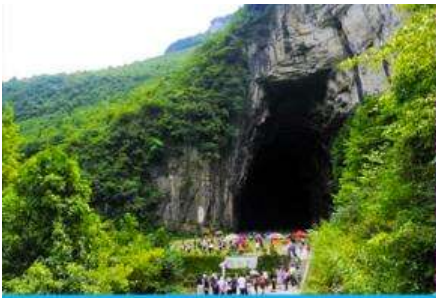
ถ้ำผญามังกร

พักที่ YICHANG HUIHAO HOTEL โรงแรมระดับ 4 ดาวหรือเทียบเท่าในเมืองหฺยซัง