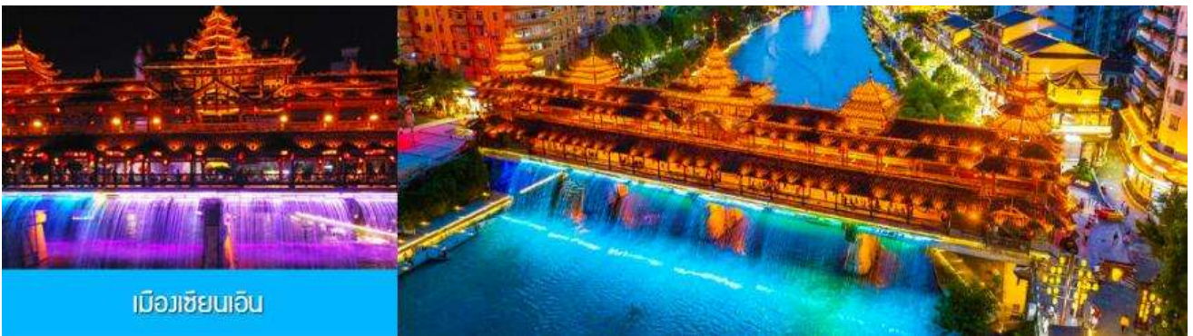
เมืองเขียนเอิน