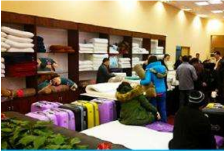
ศูนย์จำหน่ายผลิตภัณ์ที่ยางพารา

พักที่ ZHENMIAN HOTEL OR YINXIANG HOTEL ระดับ 4 ดาวท้องถิ่นหรือเทียบเท่าในเมืองจางเจียเจี๋ย