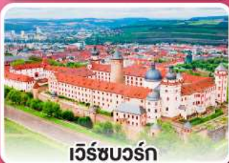
เวิร์ชบวร์ค