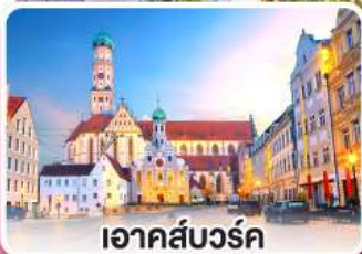
เอาคส์บวร์ค