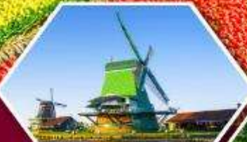
หมู่บ้านกังหันลม ซานส์ตีบส์