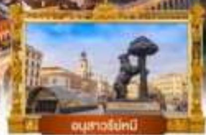
อนุสาวรีย์โทนี

เมนู พิเศษ! ข้าวผัดลูปเป + หมูกับอับเล็งชี้อ