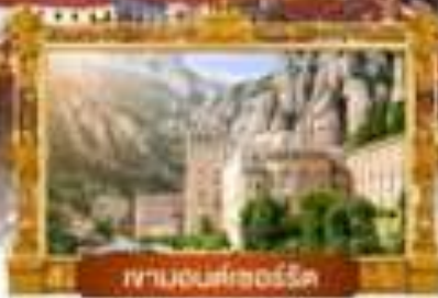
ซานอนโตนิโอ