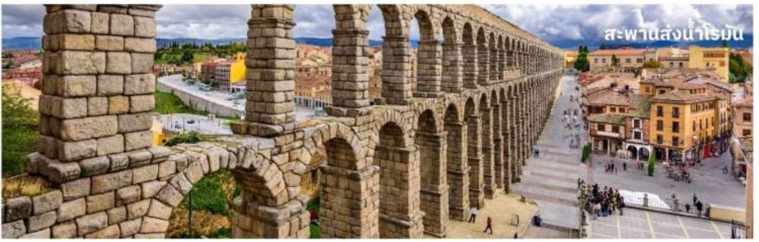
สะพานส่งน้ำโรมัน