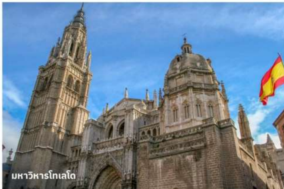
มหาวิหารโทเลโด

จากนั้นนำท่านเดินทางเข้าสู่ ย่านเขตเมืองเก่าโทเลโด นำท่านถ่ายรูปด้านหน้า มหาวิหารโทเลโด (Toledo Cathedral) เป็นมหาวิหารโกธิกที่งดงามที่สุดแห่งหนึ่งในยุโรป และนำท่านถ่ายรูปที่ อัลกาซาร์แห่งโทเลโด (Alcázar of Toledo) ปราสาทที่ตั้งอยู่บนยอดเขาในเมือง เป็นสัญลักษณ์สำคัญของโทเลโด ปัจจุบันเป็นพิพิธภัณฑ์กองทัพ จากนั้นอิสระให้ท่านได้เดินเล่นภายในตัวเมืองเพื่อเลือกซื้อสินค้าที่ระลึกตามอัธยาศัย