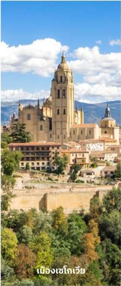
เมืองเซโกเวีย

นำท่านถ่ายรูปกับ มหาวิหารแห่งเมืองเซโกเวีย และ สะพานส่งน้ำโรมัน ที่มีชื่อเสียงนำชมเขตเมืองเก่าซึ่งล้อมรอบด้วยกำแพงที่สร้างขึ้นตั้งแต่คริสต์ศตวรรษที่ 8 และได้รับการบูรณะในระหว่างคริสต์ศตวรรษที่ 15