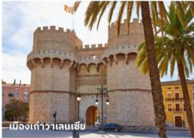
เมืองเก่าวาเลนเซีย

จากนั้นนำท่านเที่ยวชม ย่านใจกลางจัตุรัสเมืองเก่า ซึ่งเป็นที่ตั้งของศาลากลาง, ที่ทำการไปรษณีย์, ร้านค้า, สนามสู่วัวกระทิง นำท่านถ่ายรูปกับ มหาวิหารวาเลนเซีย หรือ มหาวิหารซานตามาเรียแห่งวาเลนเซีย (Catedral de Santa Maria de Valencia) มหาวิหารที่ตั้งอยู่บริเวณใจกลางเมืองเก่า สร้างขึ้นในสไตล์ผสมผสานอาทิ โกรธิค, นีโอคลาสสิก, บาร็อค