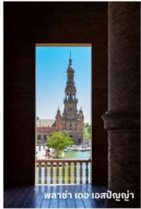
พระราชวัง อัลฮามบรา

ถึงเวลาอันสมควรนำท่านเดินต่อไปยัง เมืองกรานาดา (Granada) ใช้เวลาเดินทางประมาณ 4 ชั่วโมง เป็นเมืองมรดกโลกในแคว้นอันดาลูซิยา ที่มีเรื่องราวมากมายผสมผสานวัฒนธรรมระหว่างศาสนาคริสต์และอิสลามเมื่อกว่า 1,000 ปีก่อนหน้านี้ แต่ยังคงทิ้งซึ่งความงดงามและมนต์ขลังไว้อย่างสมบูรณ์