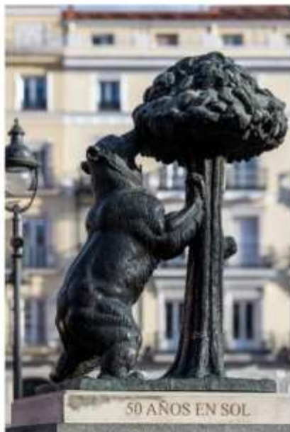
50 AÑOS EN SOL