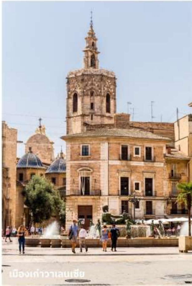
เมืองเก่าวาเลนเซีย