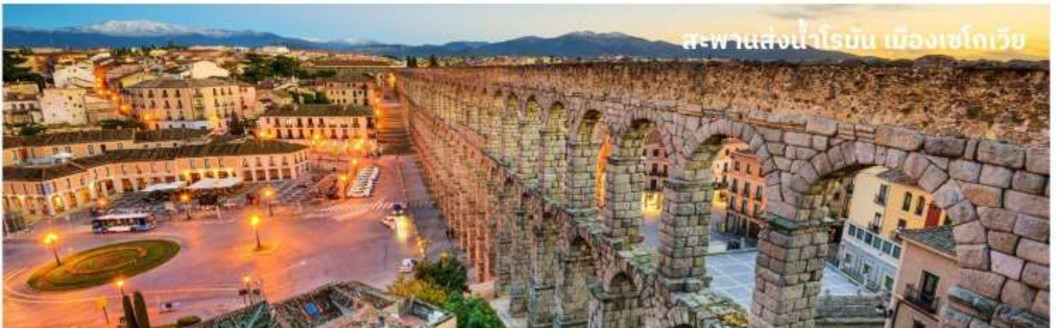
สะพานส่งน้ำโรมัน เมืองเซโกเวีย

ท่านสามารถทำการสแกน QR CODE นี้ เพื่อรับชมข้อมูลดังต่อไปนี้ สถานที่ท่องเที่ยวในเมืองเซโกเวีย (Segovia)