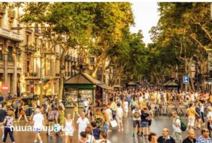
ถนนลารัมบลลา