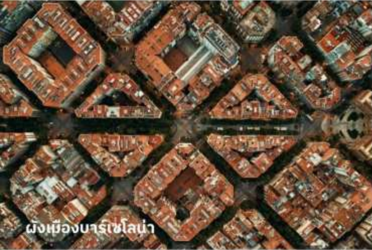
ผังเมืองบาร์เซโลน่า