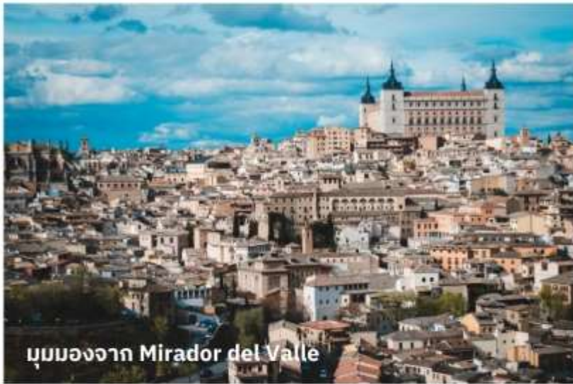
มุมมองจาก Mirador del Valle

จากนั้นเดินทางสู่ เมืองโทเลโด (Toledo) ใช้เวลาเดินทางประมาณ 1 ชั่วโมง อดีตเมืองหลวงเก่าของสเปนตั้งแต่คริสต์ศตวรรษที่ 13 เป็นเมืองแห่งศูนย์กลางประวัติศาสตร์และวัฒนธรรมของสเปน ตั้งอยู่ในแคว้นกัสติยา-ลามันชา ประเทศสเปน โดดเด่นด้วยความหลากหลายทางวัฒนธรรมที่ผสมผสานระหว่างคริสต์ ยิว และมุสลิมจนได้รับการขึ้นทะเบียนเป็นมรดกโลกโดยยูเนสโกในปี 1986