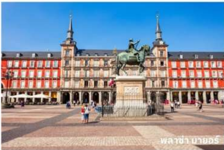
พลาซ่า มายอร์

จากนั้นนำท่านเดินทางสู่ กรุงมาดริด (Madrid) เมืองหลวงของประเทศสเปน ตั้งอยู่ใจกลางแหลมไอบีเรีย ในระดับความสูง 650 เมตร เป็นมหานครอันทันสมัยล้ำยุคที่กษัตริย์ฟิลลิปที่ 2 ได้ทรงย้ายที่ประทับจากเมืองโทเลโดมาที่นี้และประกาศให้มาดริดเป็นเมืองหลวงใหม่ ยกเว้นในช่วงประมาณปี ค.ศ. 1601-1607 เมื่อพระเจ้าฟิลลิปที่ 3 ได้ย้ายเมืองหลวงไปที่เมืองวัลลาโดลิด มาดริดได้ชื่อว่าเป็นเมืองหลวงที่สวยงามที่สุดแห่งหนึ่งในโลกและสูงสุดแห่งหนึ่งในยุโรป จากนั้นผ่านชม น้ำพุไซเบเลส (Cibeles Fountain) ที่สร้างอุทิศให้แก่เทพธิดาไซเบลิน เป็นสถานที่ที่ใช้ในการเฉลิมฉลองในเทศกาลต่างๆของเมือง และนำท่านเดินทางสู่ พลาซ่า มายอร์ (Plaza Mayor) ใกล้เคียง เขตปูเอตาเดลซอล หรือประตูพระอาทิตย์ ซึ่งเป็นจุดสนใจกลางเมือง นับเป็นจุดนัดภักโกลเมตรแรกของสเปน (กิโลเมตรที่ศูนย์) และยังเป็นศูนย์กลางรถไฟใต้ดินและรถเมล์ทุกสาย นอกจากนี้ยังเป็นจุดตัดของถนนสายสำคัญของเมืองที่หนาแน่นด้วยร้านค้าและห้างสรรพสินค้าใหญ่มากมาย