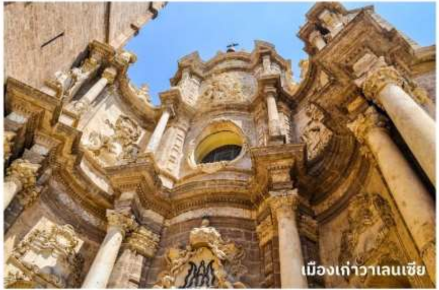
เมืองเก่าวาเลนเซีย