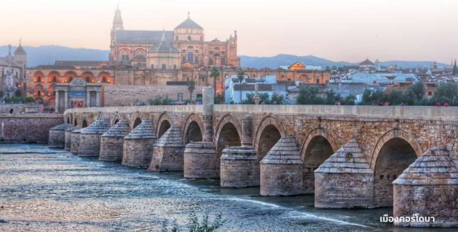
เมืองคอร์โดบา

บริการอาหารค่ำ ณ ภัตตาคาร นำท่านเข้าสู่ที่พัก Macia Alfaros หรือเทียบเท่า