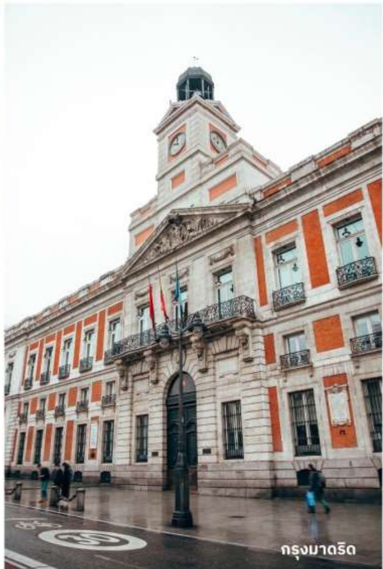
กรุงมาดริด