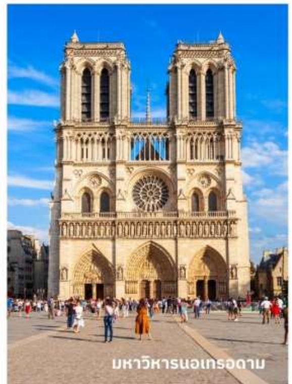
มหาวิหารนอเทรอดาม

จากนั้นนำท่านเดินทางสู่ กรุงบรัสเซลส์ ใช้เวลาเดินทางประมาณ 3.30 ชั่วโมง เมืองหลวงของ เบลเยียม บรัสเซลส์ เปรียบเสมือนพืพิภรภัณฑ์กลางแจ้ง อาคารบ้านเรือนได้รับการอนุรักษ์ไว้จากรัฐบาล