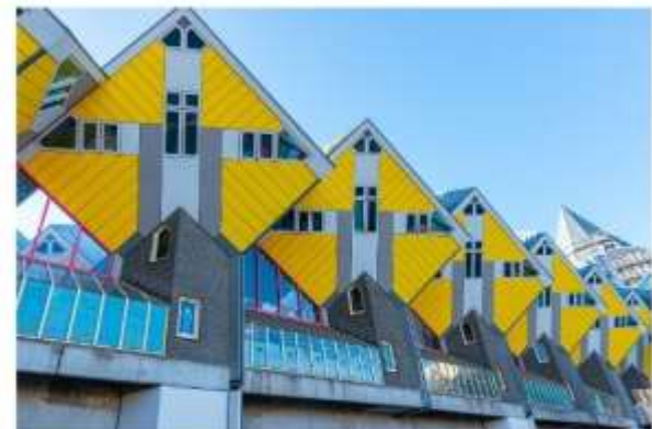
บ้านลูกเต๋าโค้คคุมุส

นำท่านถ่ายรูปกับ บ้านลูกเต๋าโค้คคุมุส (Kijk Kubus The Cubic Houses) กลุ่มอาคารเหลืองขาวทรงลูกเต๋า 39 หลัง ซึ่งได้รับรางวัลชนะเลิศการออกแบบสาขาประหยัดพลังงาน โดยสถาปนิกนาม Piet Bloem