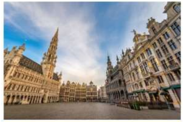
จัตุรัสกรองปลาช

จากนั้นนำท่านสู่ จัตุรัสกรองปลาช จตุรัสอันงดงามที่สุดแห่งหนึ่งของยุโรป ได้รับการยกย่องจากนักท่องเที่ยวทั่วโลก หรือแม้แต่อาร์คดัชเชสอิสซาเบลลา ธิดาของกษัตริย์ฟิลิปที่ 2 แห่งสเปน, วิกเตอร์ ฮูโก และชาร์ลส โบเดอแลร์ สองนักเขียนชื่อดังยังกล่าวถึง