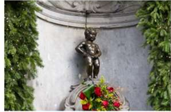
รูปปั้นแมนเนเก่นพิส

นำท่านไปชม รูปปั้นแมนเนเก่นพิส รูปปั้นเจ้าหนูน้อยที่โด่งดัง อิสระให้ท่านเดินเล่นชมเมืองหรือเลือกซื้อสินค้าของเมืองอาทิ ช็อคโกแลต เบลเยี่ยมผลิตช็อคโกแลตกว่า 172,000 ตันต่อปี และมีร้านขายช็อคโกแลต กว่า 2,000 ร้าน, ฝ่าปากลูกไม้ หรือลิ้มลองวาฟเฟิลของอร่อยที่หาชิมได้ไม่ยาก