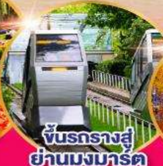
ชั้นรางสู่ ย่านมงมาร์ต