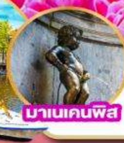
มานเคนพิส