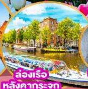
ล่องเรือ หลังคากระจุก