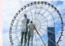
รูปปั้นอาลีและนีโน