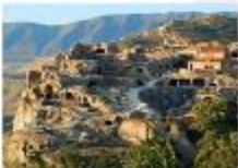
เมืองอุพลิสซิเค