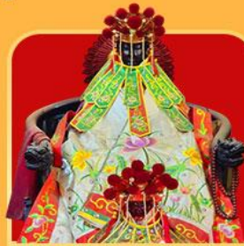
เจ้าแม่กวนอิมสองห้า