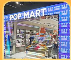
ช้อปปิ้ง POP MART