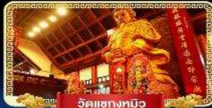
วัดเข่งหมิว