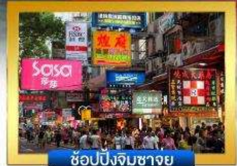
ช้อปปิงจิมซาจู้