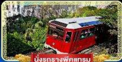
นั่งรถรางพิกเจอร์