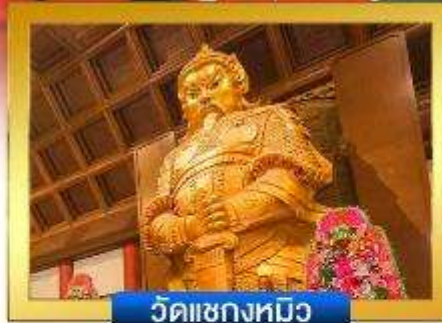
วัดเขกหมิว

📍 อีสระ-ช้อปปิงย่านจิมซาจู้ & คอสเวย์เบย์