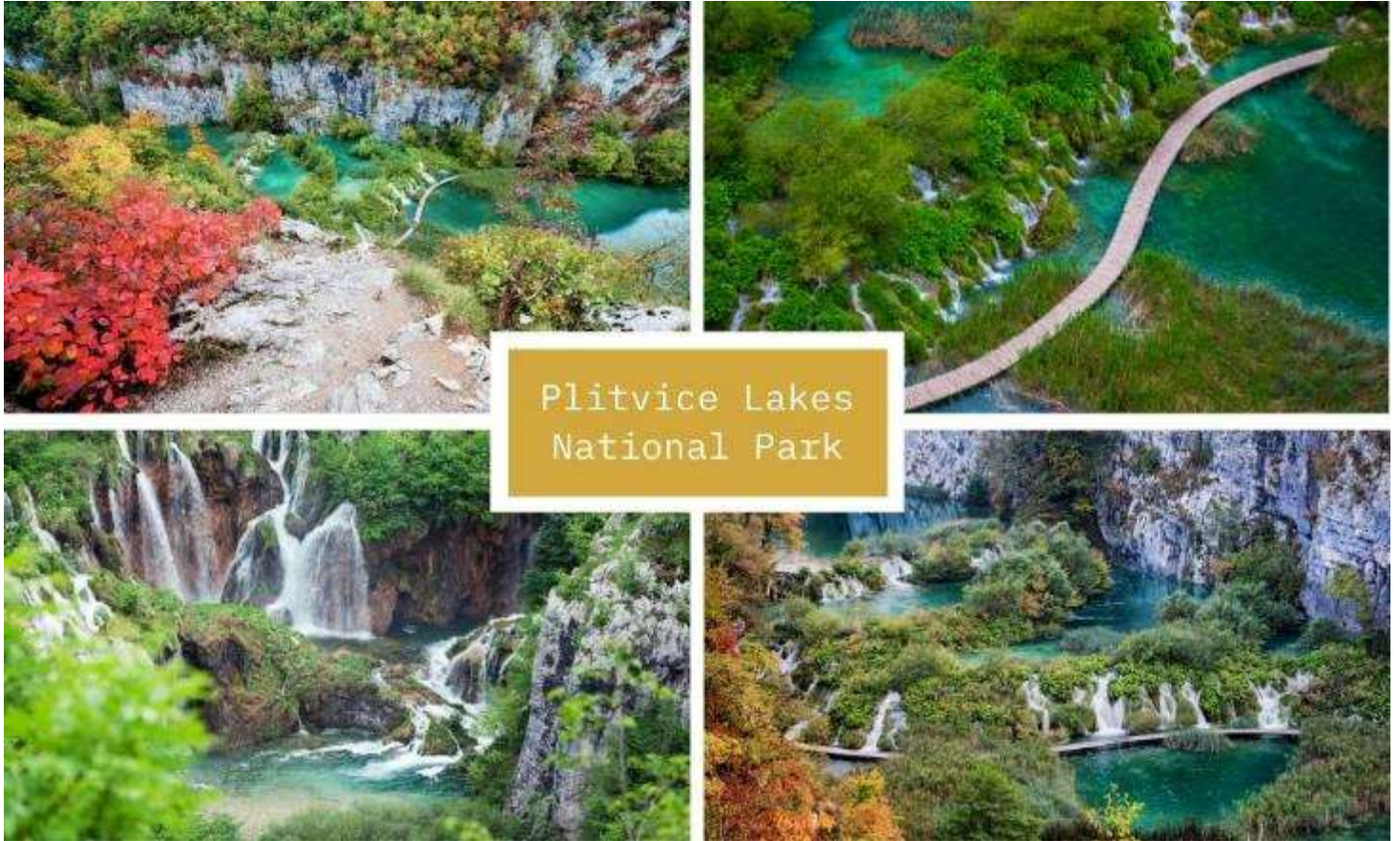
Plitvice Lakes National Park