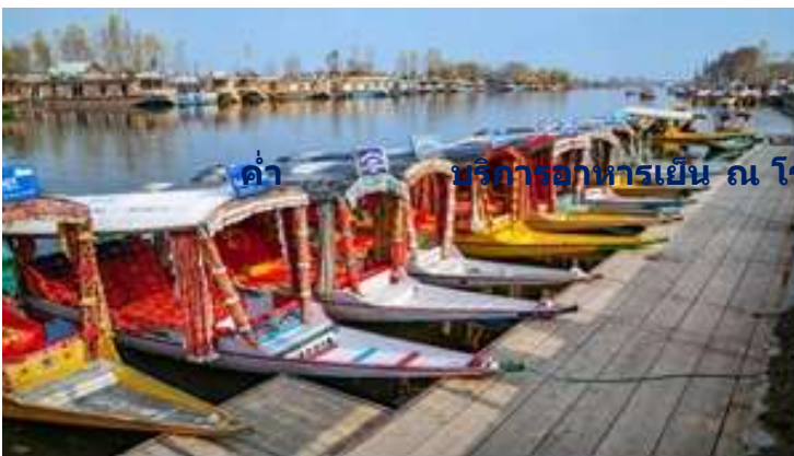
ค่า บริการอาหารเย็น ณ โรงแรม