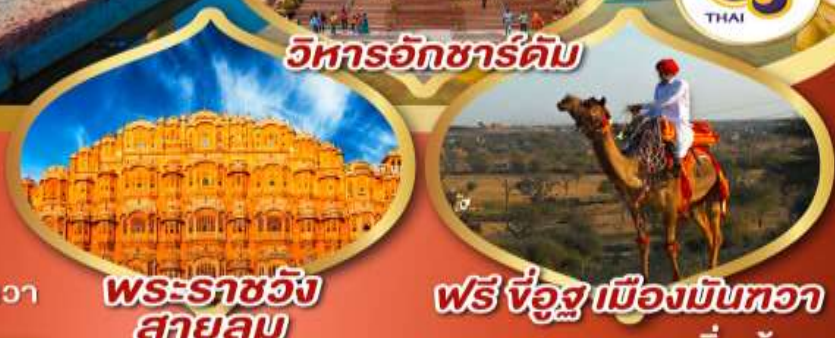
วิหารอักชาร์ดัม