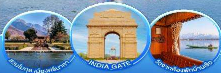
สวนโมกุล เมืองศรีนาคา