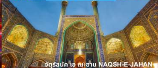
จัตุรัสบิก ไอ ฉะฮาน NAQSH-E-JAHAN