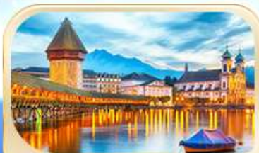
สะพานไมซ์ฮาเปล