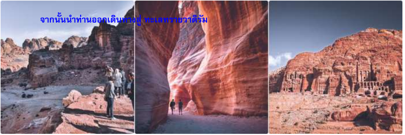
จากนั้นนำท่านออกเดินทางสู่ ทะเลทรายวาดีรัม

ค้ำ รับประทานอาหารค้ำ ณ แคมป์ที่พัก ที่พัก LUXURY RUM MAGIC CAMP (BUBBLE TENT) หรือเทียบเท่า