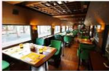
SHIKOKU MANNAKA SENNEN MONOGATARI