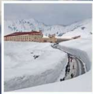
กำแพงหิมะ เจแปนแอลป์