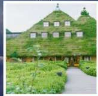
ลา โคสึน่า โอมิฮะจิมัง

พิเศษท่องเที่ยวสวนสนุกยูนิเวอร์ซัล สตูดิโอส์เต็มวัน สวนสาธารณะซากุระปราสาทคาเคียว 1 ใน 3 สุดยอดจุดชมซากุระแห่งญี่ปุ่น สักการะพระพุทธรูปในอาคาร ที่ใหญ่ที่สุดในญี่ปุ่น เอจิเซ็นโดบุตสึ เปิดประสบการณ์อัศจรรย์กำแพงหิมะ บนเทือกเขาเจแปนแอลป์ ชมประวัติศาสตร์และร้านขนมดังลา โคสึน่า แห่งเมืองโอมิฮะจิมัง พักผ่อนเป็นอย่างดี 3 คืน 2 ริมทะเลสาบ!!! อาหารพิเศษ...บุฟเฟ่ต์อาหาร + เครื่องดื่มแอลกอฮอล์ไม่อั้น กรุ๊ปสบายๆ เพียง 20 ท่านเท่านั้น!!!