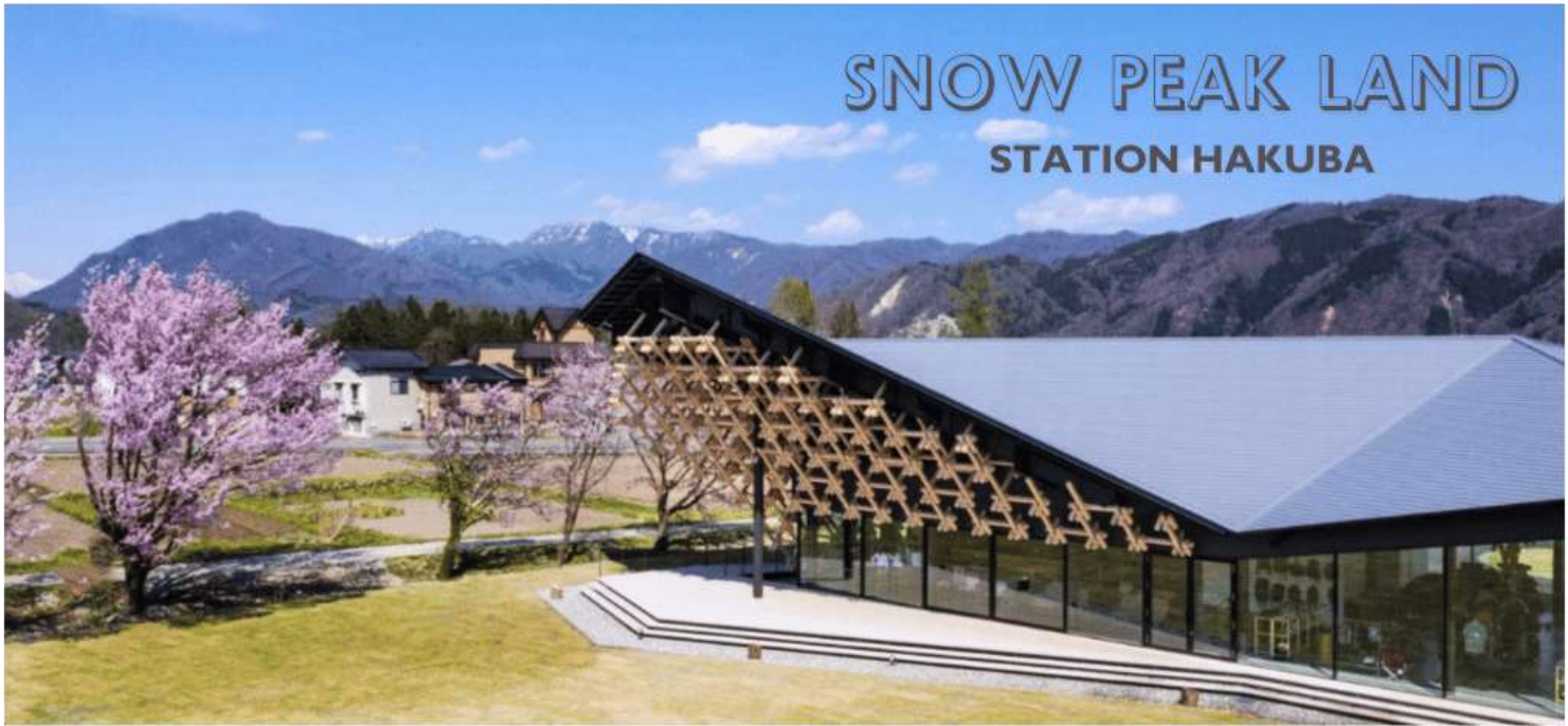
รูปใช้ประกอบการโฆษณาเท่านั้น