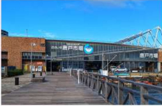
KARATO FISH MARKET

“ตลาดปลาคาราโตะ” เป็นตลาดปลานขนาดใหญ่ มีชื่อเสียงเรื่องความสดใหม่ของอาหารทะเล โดยเฉพาะปลาปักเป้า ปลาโก และปลาฮามาจิ ที่เป็นของดีประจำถิ่น สืบลองซูชิที่ทำจากวัตถุดิบสดๆ ส่งตรงจากทะเล พร้อมชนบทบรรยากาศตลาดปลานญี่ปุ่นที่คึกคักและมีชีวิตชีวา