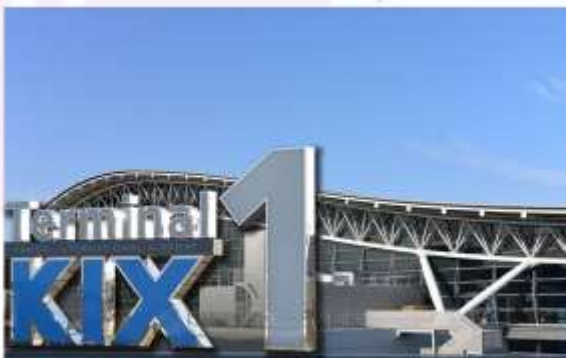
KANSAI INTERNATIONAL AIRPORT