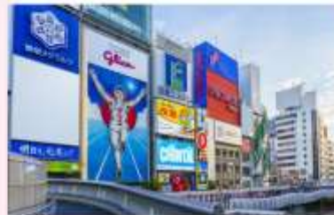
SHOPPING AT SHINSAIBASHI