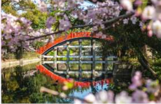
SUMIYOSHI TAISHA SHRINE