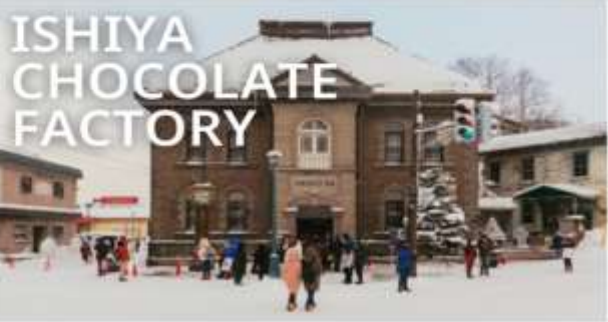
ISHIYA CHOCOLATE FACTORY