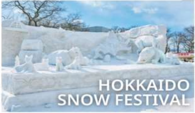
HOKKAIDO SNOW FESTIVAL