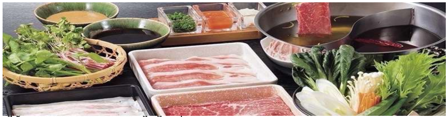
ที่พัก : SHINJUKU PRINCE HOTEL หรือเทียบเท่า

เย็น บริการอาหารเย็น ณ ภัตตาคารอาหารท้องถิ่นญี่ปุ่น (8) บริการทำนวดด้วยอาหารญี่ปุ่นบุฟเฟ่ต์ชาบู ชาบู สไตล์ญี่ปุ่นแท้ ๆ เสริฟด้วยเนื้อหมูสไลด์เป็นชั้นสวยงาม เนื้อไก่ และผักสดนานาชนิด อาทิเช่น เห็ดเข็มทอง เห็ดหอม ผักกาดขาว ต้นหอมญี่ปุ่น ให้ท่านรับประทานอย่างจุใจ พร้อมเครื่องดื่มชอฟอร์ดริงค์