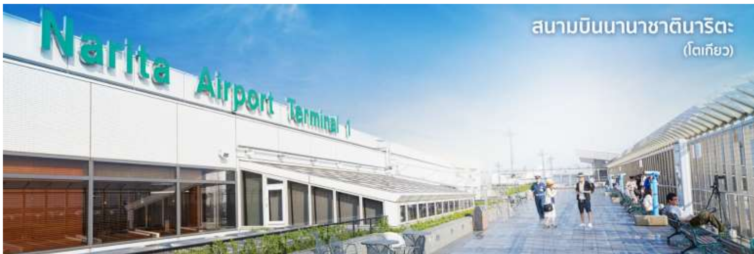
สนามบินนานาชาติหนาริตะ (โตเกียว)

10.55 น. เดินทางถึง ท่าอากาศยานนานาชาติหนาริตะ ประเทศญี่ปุ่น (เวลาที่ประเทศญี่ปุ่นจะเร็วกว่าประเทศไทย 2 ชม. ควรปรับนาฬิกาของท่านเพื่อสะดวกในการนัดหมาย) นำท่านผ่านขั้นตอนการตรวจคนเข้าเมืองและศุลกากร พร้อม ตรวจเช็คสัมภาระ เรียบร้อยแล้ว สำคัญมาก!! ประเทศญี่ปุ่นไม่อนุญาตให้นำอาหารสด เนื้อสัตว์ พืช ผัก ผลไม้ เข้าประเทศ หากฝ่าฝืนมีโทษปรับและจับ