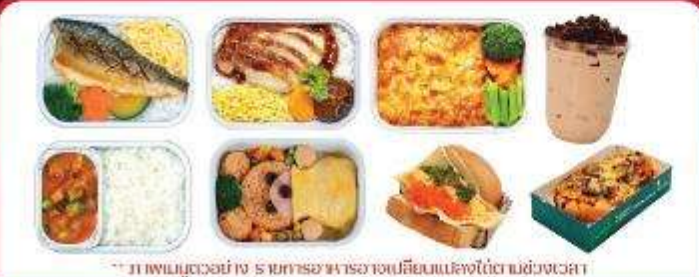
** ภาพเมนูตัวอย่าง รายการอาหารอาจเปลี่ยนแปลงได้ตามช่วงเวลา