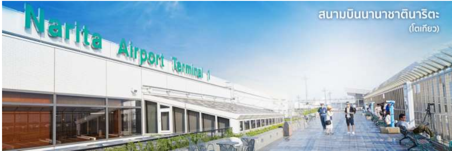
สนามบินนานาชาตินาริตะ (โตเกียว)

10.55 น. เดินทางถึง ท่าอากาศยานนานาชาตินาริตะ ประเทศญี่ปุ่น (เวลาที่ประเทศญี่ปุ่นจะเร็วกว่าประเทศไทย 2 ชม.ควรปรับนาฬิกาของท่านเพื่อสะดวกในการนัดหมาย) นำท่านผ่านขั้นตอนการตรวจคนเข้าเมืองและศุลกากร พร้อม ตรวจเช็คสัมภาระ เรียบร้อยแล้ว สำคัญมาก!! ประเทศญี่ปุ่นไม่อนุญาตให้นำอาหารสด เนื้อสัตว์ พืช ผัก ผลไม้ เข้าประเทศ หากฝ่าฝืนมีโทษปรับและจับ