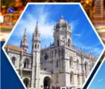
มหาวิหารเจโรนิโม