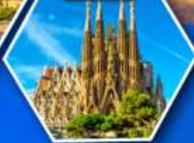
โบสถ์ซากราดา แพมีเลีย