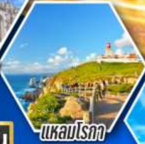
แควมโรกา