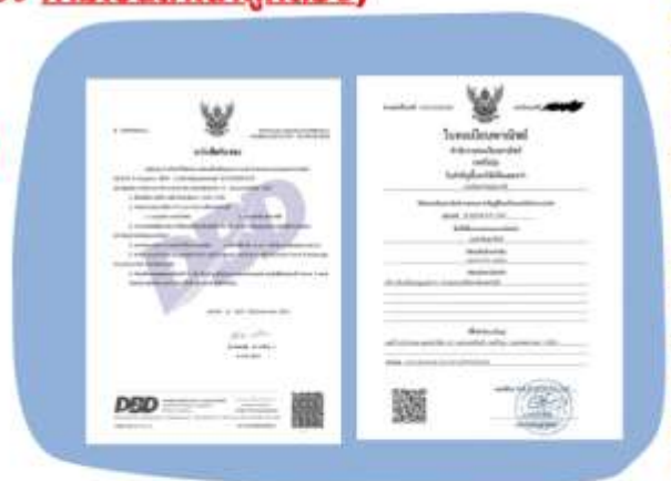
ตัวอย่างหนังสือจดทะเบียนบริษัทฯ และ ใบทะเบียนพาณิชย์