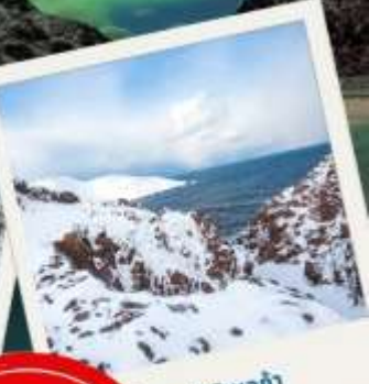
เทอริเบอก้า