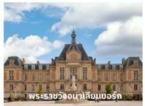
พระราชวังมาเลเซียนบอร์ก