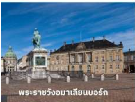
พระราชวังมาเลเซียนบอร์ก