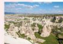
หุบเขาเทพเรนท์

** พักที่ Dedeli Cave Hotel 5* หรือเทียบเท่า **