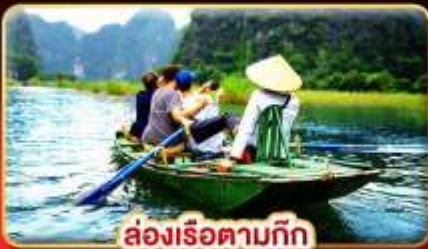
ล่องเรือตามกีก