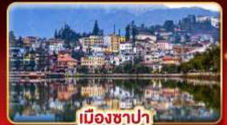
เมืองซาปา