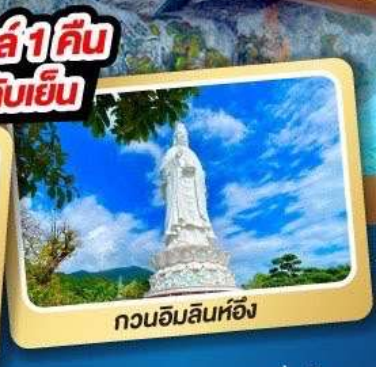
กวนอิมลินห์ฮิ่ง